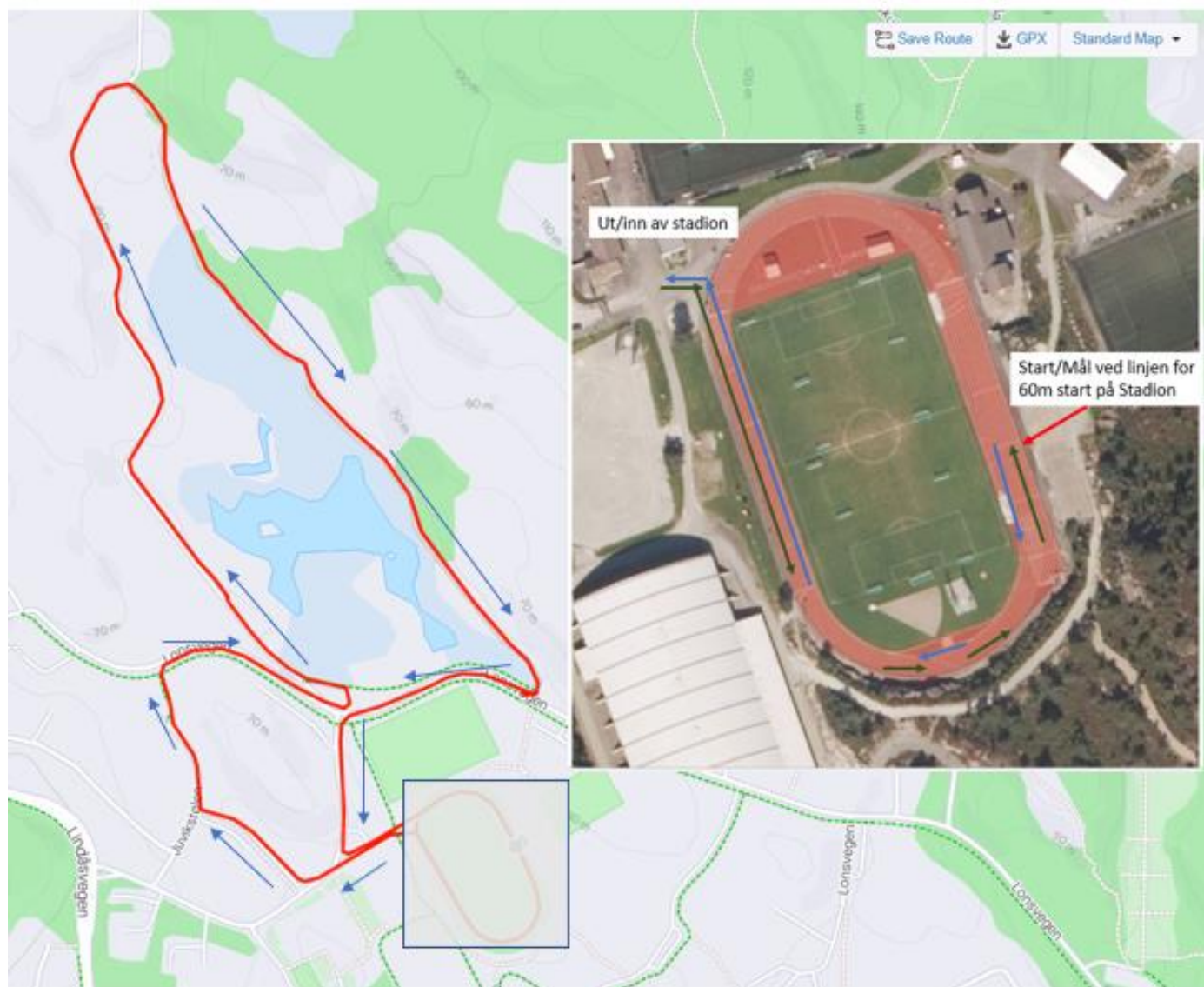
Figur 2 : Løypekart 3K