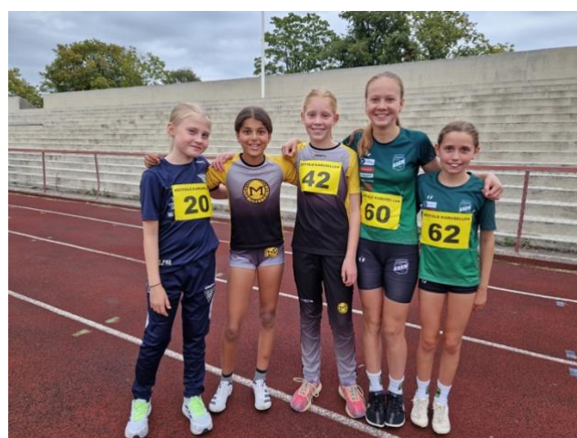
Bilder fra noen utvalgte karusellstevner rundt i Østfold. Bildet viser nok aktive J11 utøvere fra FIF, SIL og MIL