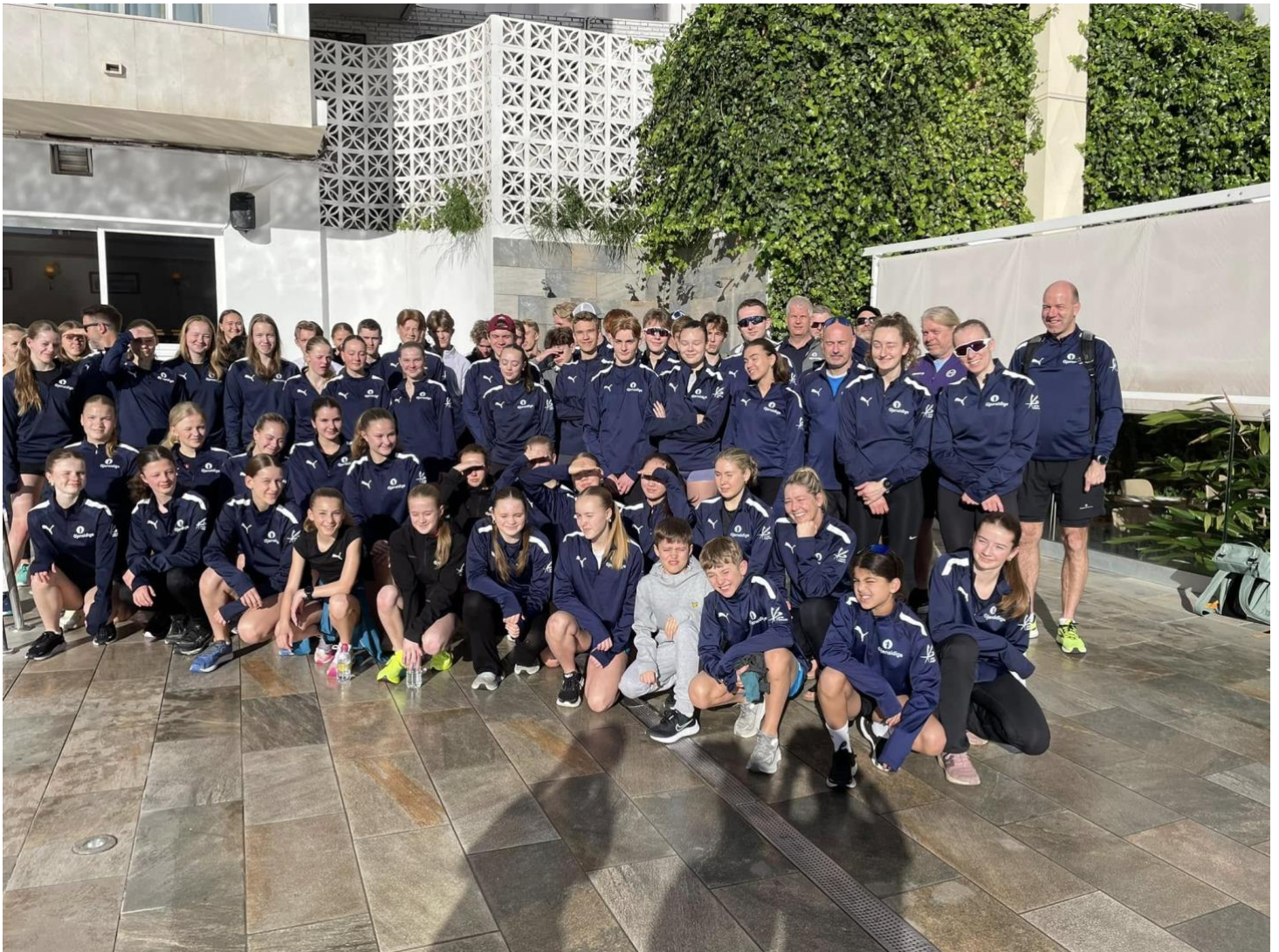
Bilde: Treningsleir Torremolinos påsken 2024