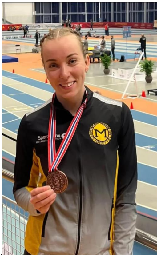
NM-medaljører innendørs 2024