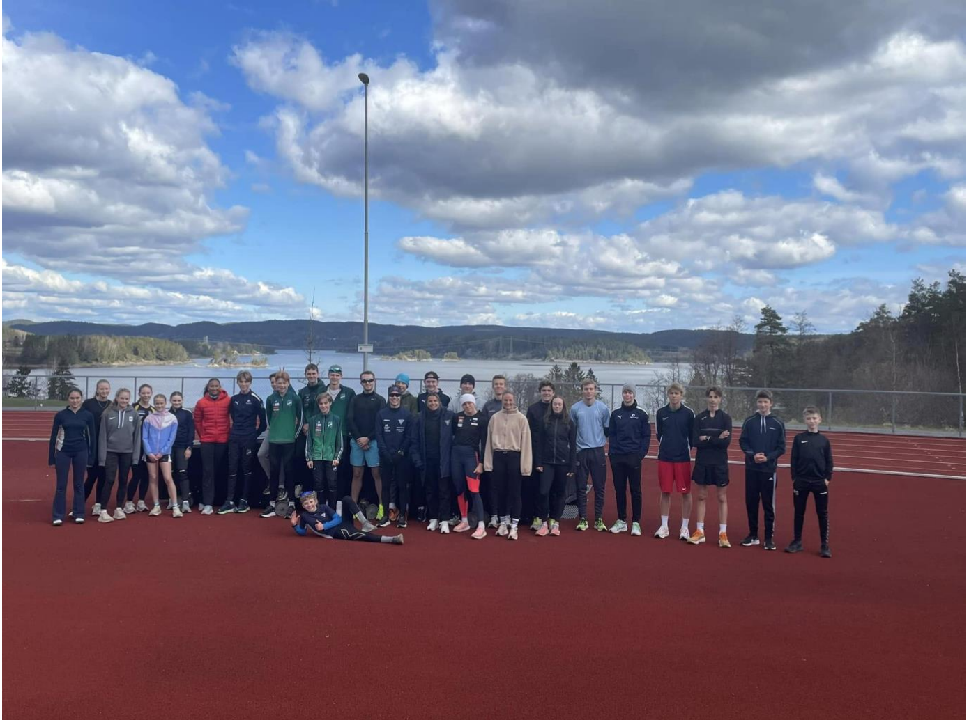
Bilde fra en av mange lørdagstreninger på Kalnes stadion hvor det ble løpt 300m intervaller og kastet spyd, diskos og kule.