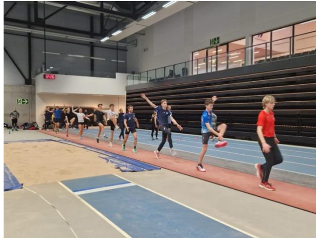
Bildene viser treninger gjennom året fra kretsens mellom og langdistanse prosjekt