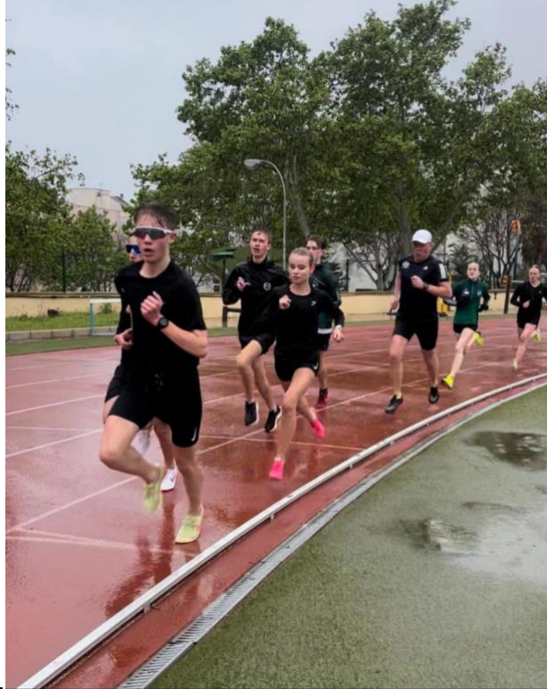
Bilder fra treingsleiren til Torremolinos påsken 2024

Kretsens treningsleir til Torremolinos ble en super treningsleir, dog ikke med været vist fra sin beste side. Det var alt fra surt og kaldt regnvær til strålende sol og god varme.