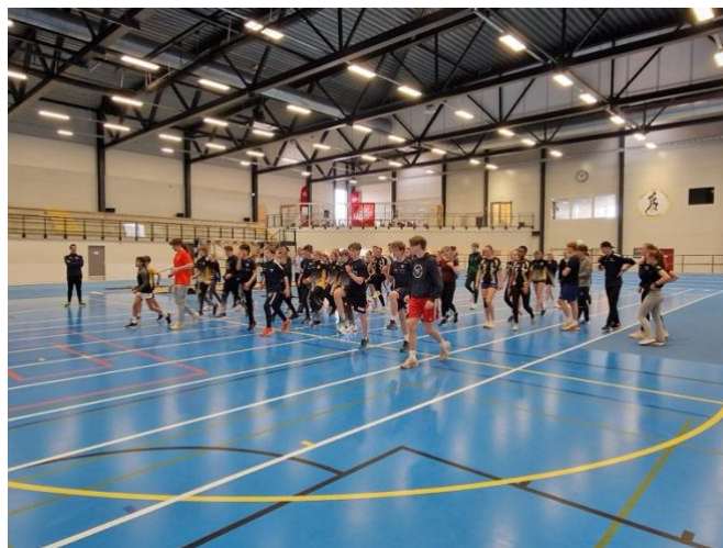
Bilder fra samling i Grimstad