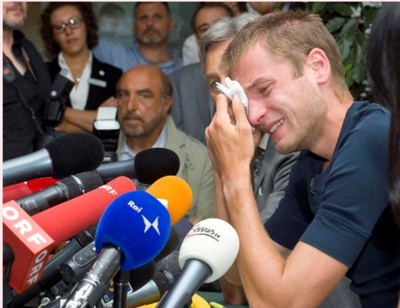
GIUKKI / FELLA: Italias Alex Schwazer under pressekonferansen der OL-gullvinneren innrømmet EPO-lyks rett for London-OL 2012. Under en rettslig høring i Bolzano